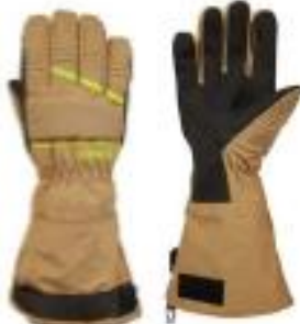
Crystal Long Beige