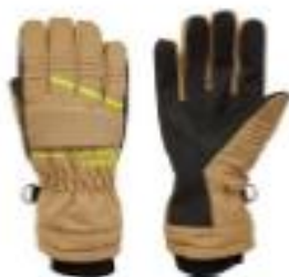
Crystal Evo Beige