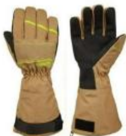
Diamond Long Beige