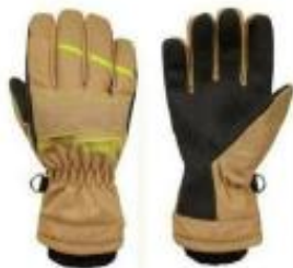
Diamond Evo Beige