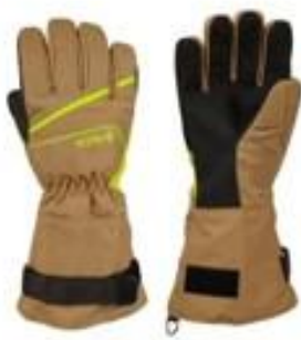
Maris Long Beige