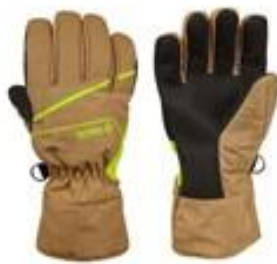
Maris Easy Beige