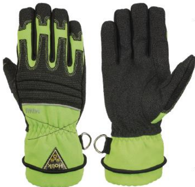
Miwa 6507 Limeta zelena

Zaštitne rukavice za vatrogasce – rukavice za operacije spašavanja